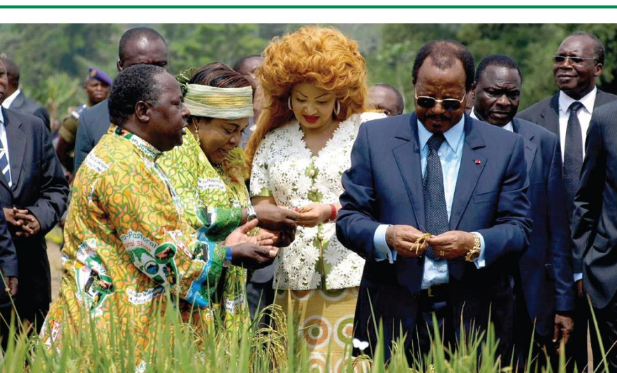
Visite du Chef de l'Etat et de la Première Dame, Madame Chantal BIYA, à l'exposition vivante de la culture du riz pluvial au Comice agropastoral d'Ebolowa en 2011. Nous sommes en situation de produire une grande partie de ce que nous importons, qu'il s'agisse de produits d'origine agricole ou industrielle.

Paul BIYA Président de la République, Chef de l'Etat, Message à la Nation, 31 décembre 2018